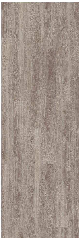
Rustic Limed Grey Oak Varenr.: B0U0001 DB nr.: 1541142