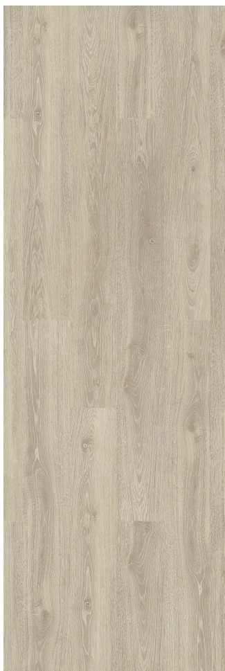
Limed Grey Oak Varenr.: B0T7001 DB nr.: 1541140