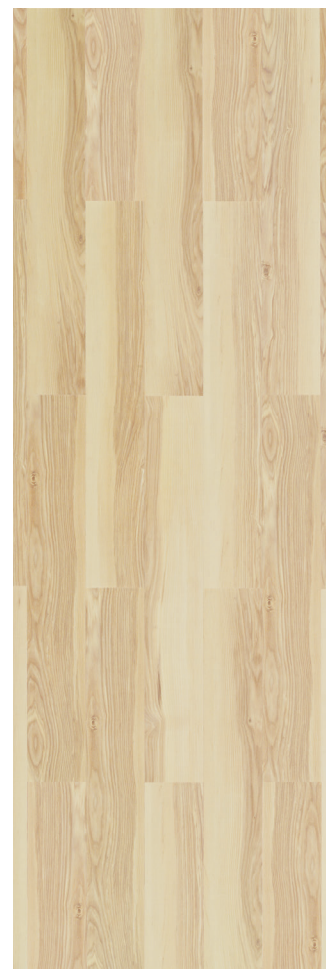
Nordic Ash Varenr.: B0V4001 DB nr.: 1541150