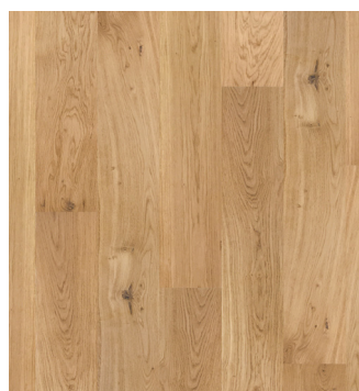
Eg Accent børstet Varenr.: 145023s DB nr.: 2307333