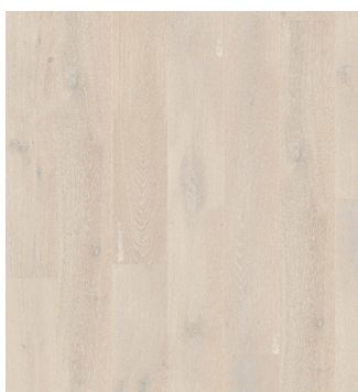
Eg Accent børstet Varenr.: 145022s DB nr.: 2307330