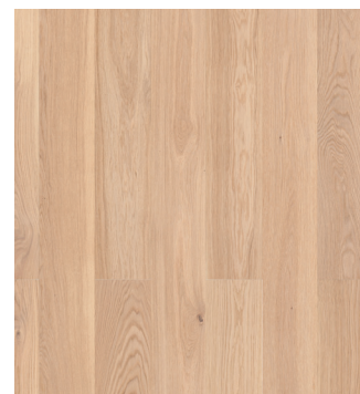
Eg Prime børstet Varenr.: 145070s DB nr.: 2307348