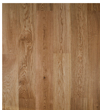
Eg Accent børstet Varenr.: 145033s DB nr.: 2307342